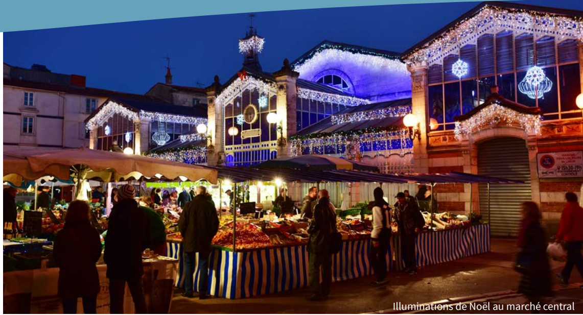
Illuminations de Noël au marché central