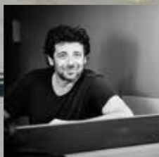
P. 38 Patrick Bruel

DÉCOUVREZ DES CONTENUS EN RÉALITÉ AUGMENTÉE EN PAGE 27