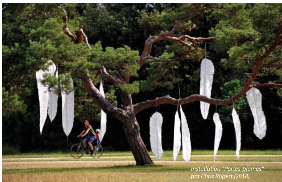
Installation "Portes-plumes" par Chris Ropert (2018)

L'acte d'écriture ne se limite pas seulement à la littérature, il est la source de la plupart des œuvres. Pour célébrer la diversité de la Francophonie, la Maison des écritures fait naître des expériences, des performances, des rencontres. Ses résidences et ateliers mettent en valeur des auteurs de tout âge, exprimant une sensibilité, une interprétation du monde, grâce à la richesse de la langue française. La Maison des écritures s'appuie sur l'expérience de structures locales et régionales comme le Centre Intermondes, le Carré Amelot, le chantier des Francos et la Cité de la BD à Angoulême. Ces rencontres, avec le grand public et entre artistes résidents, permettent de faire fusionner les talents, les disciplines, de prolonger et d'enrichir le travail de création.