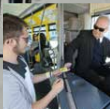
P. 17 Pour des transports solidaires