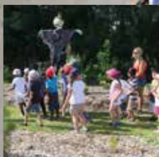
P. 8 Rendez-vous aux jardins