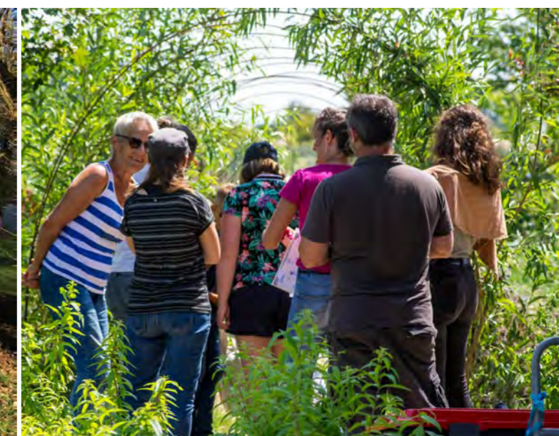
Bio Pôle de Léa Nature / Graine de Troc